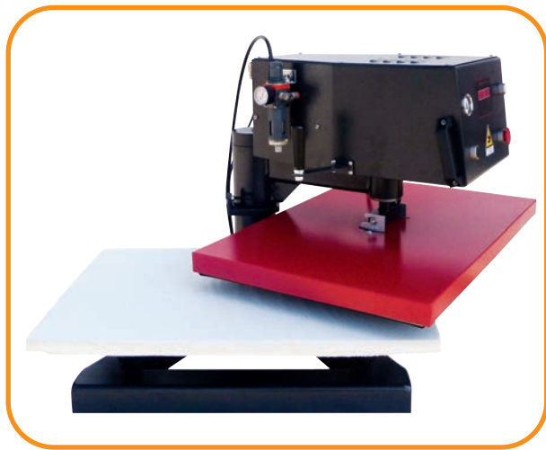
Fig. 2 - einfaches Schwenken